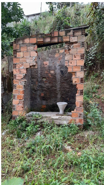
Figura 2. Tipo de banheiro improvisado comumente encontrado no bairro.

A água potável também se mostrou bastante problemática, já que não há abastecimento regular. Assim, os moradores não sabem quando terão água para consumo ou higiene. As caixas d'água de uso coletivo (Figura 3), abastecidas de forma irregular pela Secretaria Municipal de Água e Esgoto, apresentam uma série de problemas por falta de manutenção. As tampas das caixas d'água possuem grandes rachaduras, furos e alta porosidade, permitindo a entrada de água da chuva, poeira, insetos e outros animais.