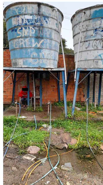
Figura 3. Caixas d'água de uso coletivo sem manutenção.

Além disso, nessa região não há coleta regular de lixo. Assim, muitos moradores recorrem a uma lixeira comunitária improvisada (Figura 4), causando um grande acúmulo de lixo. Quando a quantidade de lixo acumulado se torna insuportável, sem assistência, os moradores veem como única opção a eliminação desse material via fogo.