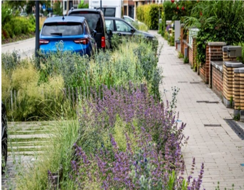
Figura 2: Leuven, Bélgica.