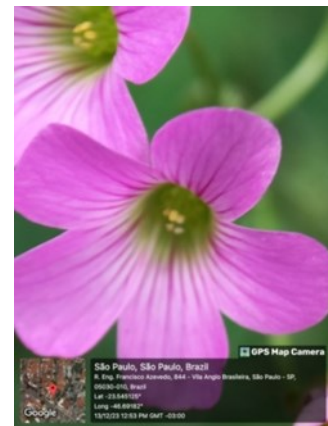
Fig. 6: Oxalis debilis Kunth.