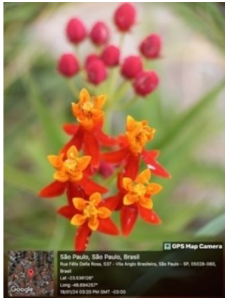
Fig. 4: Asclepias curassavica L.