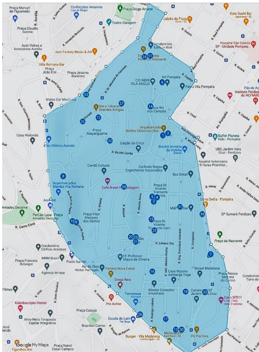
Figura 3: Vista aérea do bairro Vila Anglo Brasileira, e localização das espécies coletadas.