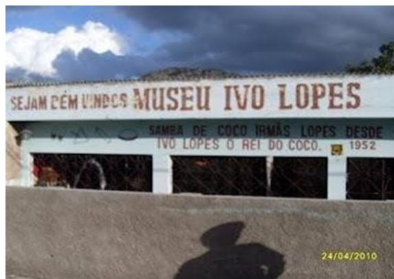
Figura 2 - Imagem da entrada do Museu Ivo Lopes em Arcoverde – PE.