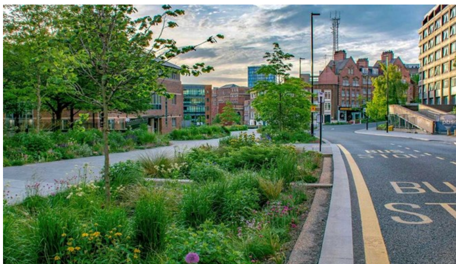
Figura 1: Sheffield, Reino Unido.