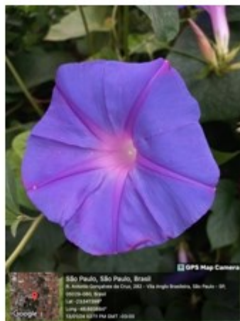
Fig. 8: Ipomoea purpurea (L.) Roth