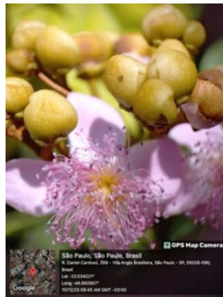
Fig. 5: Bixa orellana L.