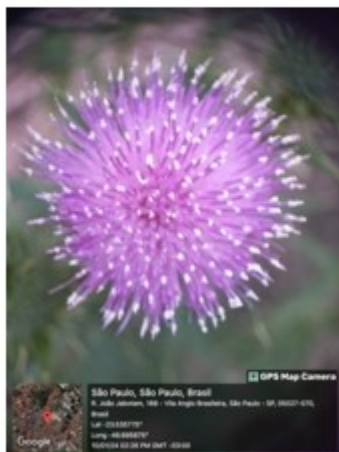
Fig. 7: Cirsium vulgare (Savi) Ten